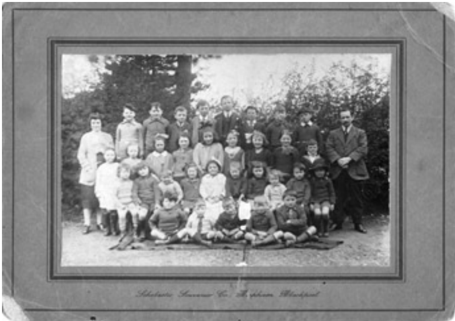
Llun o Ysgol Carrog o gwmpas canol y 30au.